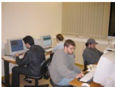
Αίθουσα Βιοπληροφορικής ΙΙ.