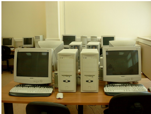
Αίθουσα Βιοπληροφορικής ΙΙ.