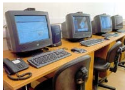
Αίθουσα Βιοπληροφορικής Ι.