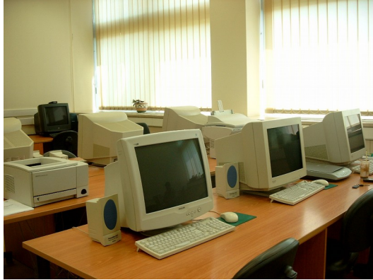
Αίθουσα Βιοπληροφορικής Ι.