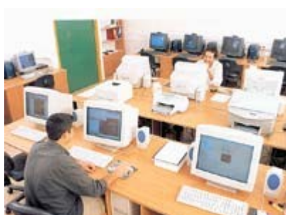
Αίθουσα Βιοπληροφορικής Ι.