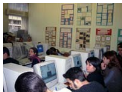
Αίθουσα διδασκαλίας Βιοπληροφορικής.