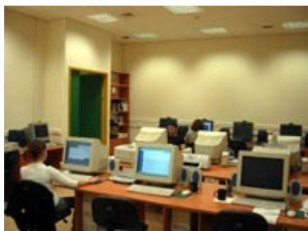
Αίθουσα Βιοπληροφορικής Ι.