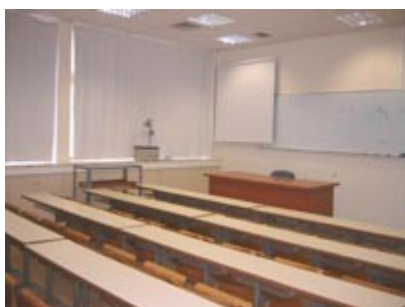
Αίθουσα διαλέξεων και παρουσιάσεων του Π.Μ.Σ.